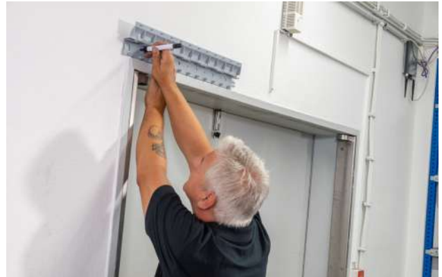
2. Löcher anzeichnen und bohren