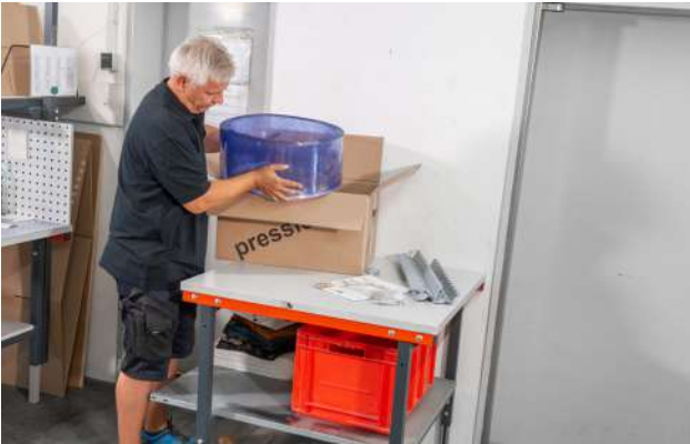
1. Pressio.fix auspacken