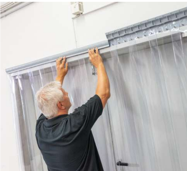
5. Schiene zuklappen