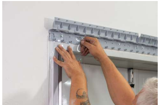
4. Streifen einhängen