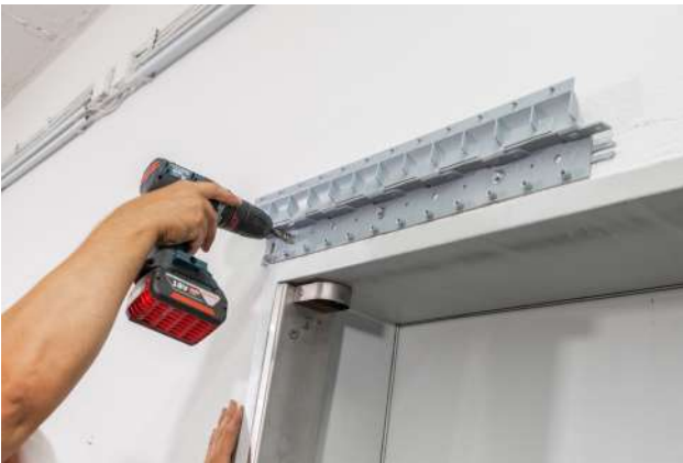
3. Schiene befestigen